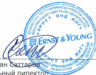
Рустамжан Саттаров Генеральный директор ТОО «Эрнст энд Янг»

Государственная лицензия на занятие аудиторской деятельностью на территории Республики Казахстан: серия МФЮ-2, № 0000003, выданная Министерством финансов Республики Казахстан от 15 июля 2005 года