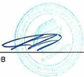
Адиль Сыздыков Аудитор

Квалификационное свидетельство аудитора № МФ - 0000172 от 23 декабря 2013 года